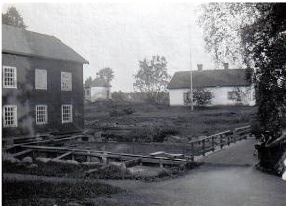
Hävla Mellanbruk. Thors familj bodde i det vita huset, som då låg intill valsverket