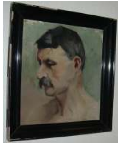
Självporträtt från akademien c:a 1905