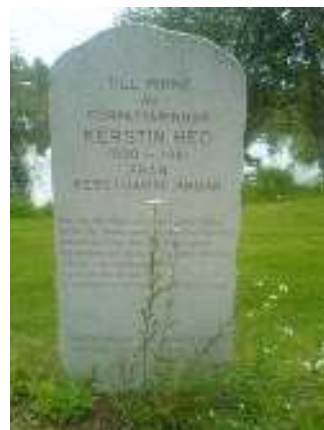
Minnesstenen vid Gammelgården