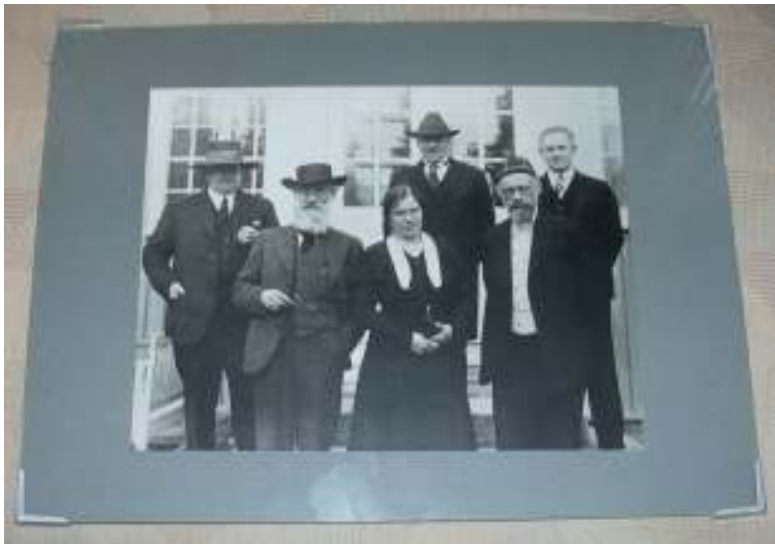
Här ser vi ett fotografi från en uppläsningafton i Ludvika 28 april 1935