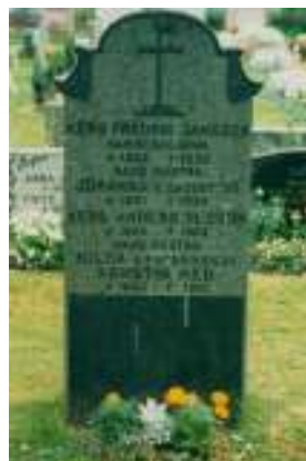
Gravplatsen på Hedemora kyrkogård