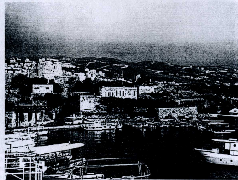
Hamnen i Byblos.