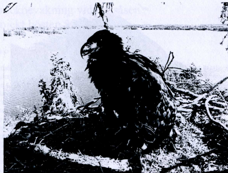
Unga havsörnen spanar ut över Sällingesjön!