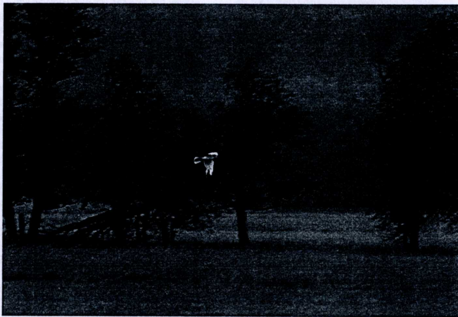
Stäpphök Västvalla 26/6 2007.

Några bilder tagna i skymningen lördagen 26 juni 2007 i Västvalla.