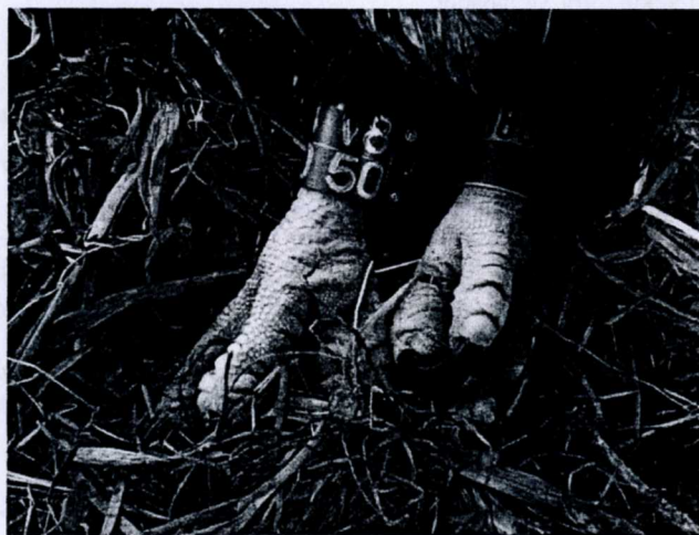
Ringmärkt unge.

mun! Den 3:e juni ringmärktes ungen av Bjarne Modigh, allt medan en av de gamla örnarna kretsade högt i skyn och klagade med varningslätet! Försommaren rullade sedan på och en av de vuxna örnarna sågs så gott som dagligen vid Sällingesjön, medan den andra verkade vara på jakt någon annanstans. Vid några tillfällen sågs 1-2 gamla fåglar vid Österhammarssjön så de verkar ha haft god jaktlycka där! 24:e juni blev sista gången som ungen sågs i boet vid Sällingesjön och den var då flygfärdig. Framtiden får visa hur den lyckas med överlevnaden, och jag hoppas att örnparet är på plats vid Sällingesjön igen nästa vår! Så till sist, håll koll efter en ringmärkt ungfågel när ni är ute i markerna i höst!!