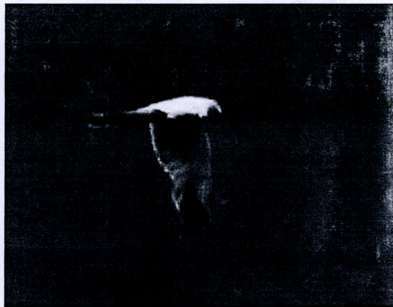
Stäpphök Västvalla 26/6 2007.