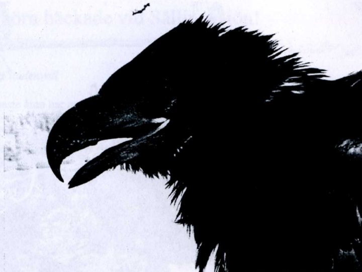
Närbild av den unga havsörnen.