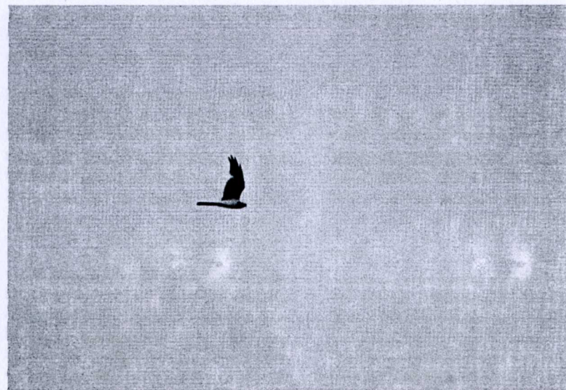
Stäpphök Västvalla 26/6 2007.