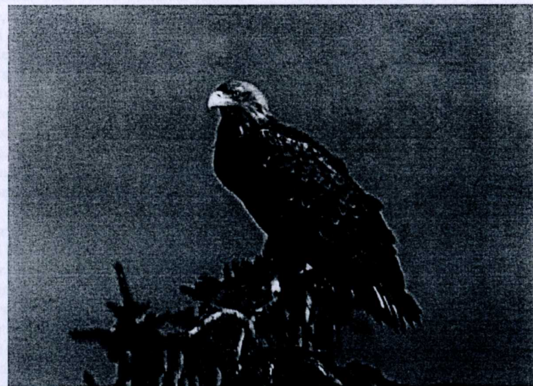
En av de gamla fåglarna, taget vid Österhammarssjön.