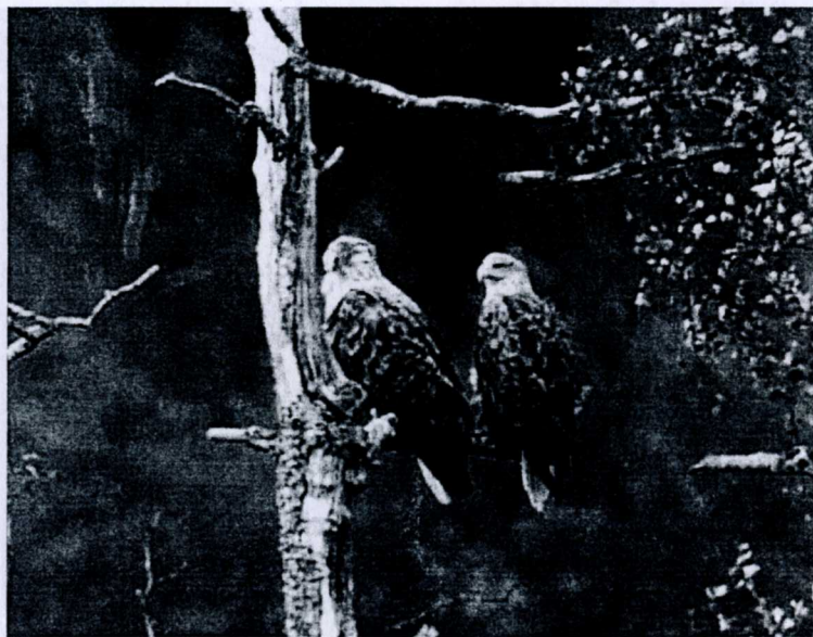
Föräldrarna tar en paus.