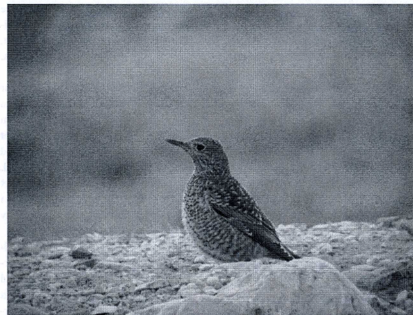
Rastande stentrast, en läckerbit

komligt översållad. Kliar mig fördärvad. Kvav nattvärme, ingen fläkt, ingen sömn, ingen ork. Men spännande fåglar finns att hitta här ute. Så jag får sova någon annan gång. Ett gäng korttälkor drar förbi lågt över marken med sina typiska kvittriga lock, ett par ortolansparvar likaså. Stäppen börjar vakna.