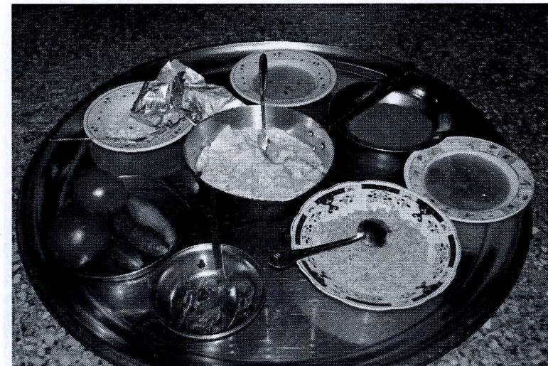
Syrisk middag, man äter med händerna sittande på golvet :)

försiktigt ner fötterna, medveten om mina vänners varning för de stickande små odjuren som dras till lampskenet under sensommarnätterna. Vid horisonten i nordväst glimmar ljusen från Palmyra, annars är stäpperna mörka, vida och öde. Generators brummar tryggt i ett skjul längre bort men bara en stund till. När denna slås av så dör vår fläkt, vårt kylskåp och vår TV. Då är det god natt, bokstavligen.