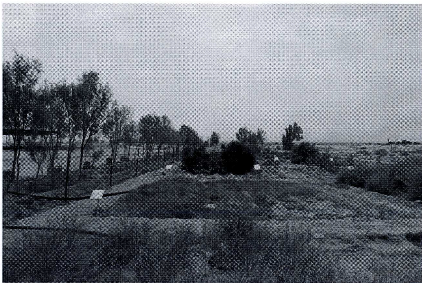
Talila's "Botanical Garden" är i torraste laget, men fågel finns det!

Centrala Syrien är en mestadels platt upplevelse och Talila är inget undantag. Stäpp och halvöken så långt ögat når, konturlöst som ett gråbrunt biljardbord