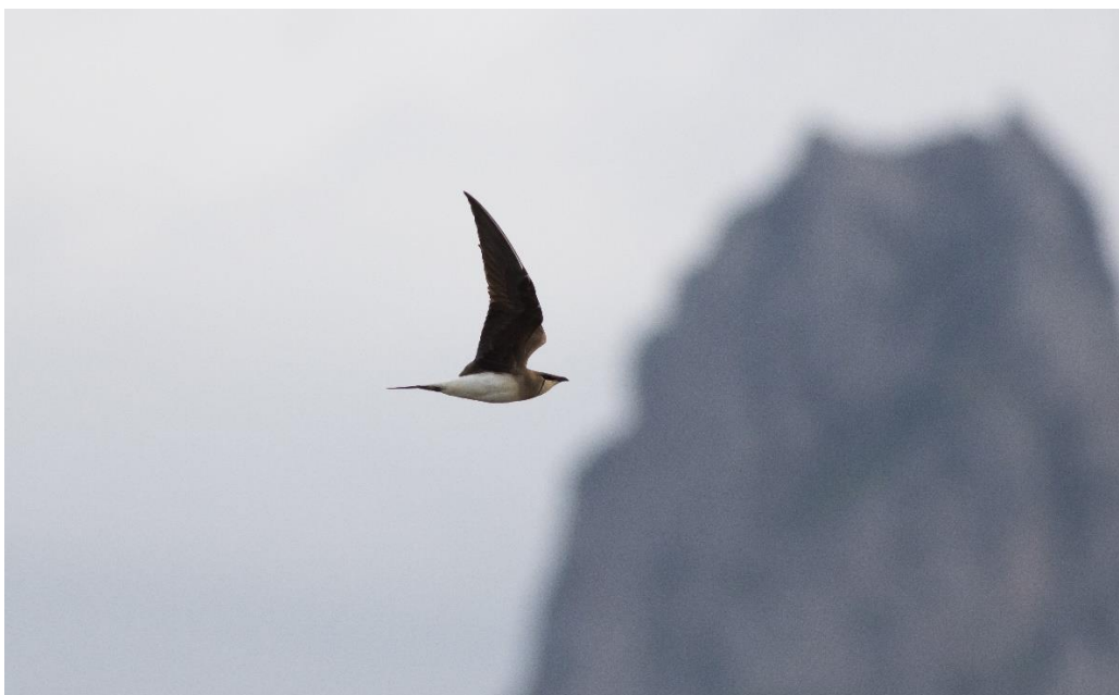
Svartvingad vadarsvala Besh barmag 2016.