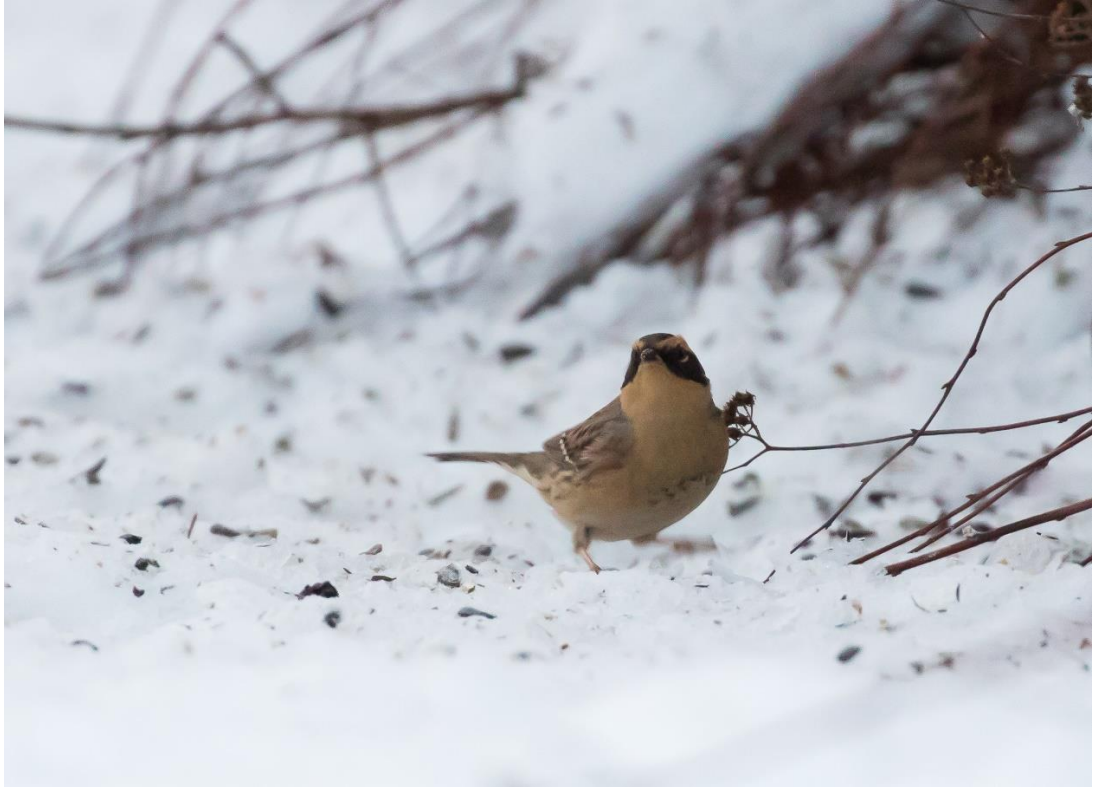
Sibirisk järnsparv Lindesberg 2016-12-18