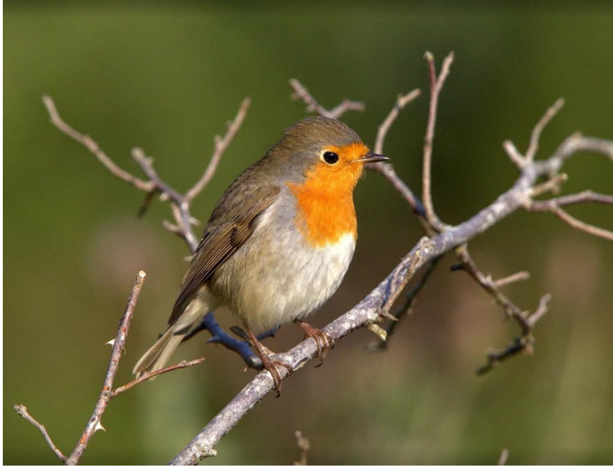
Rödhake