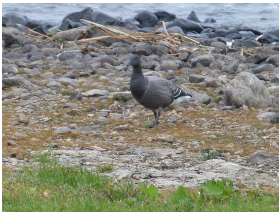
Prutgås som inte orkat hänga med sina kamrater