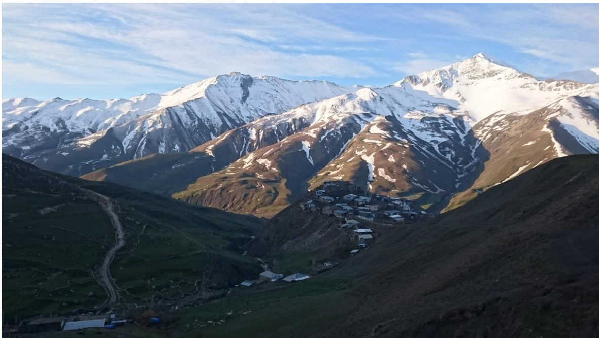
Bergsbyn Xinaliq 2016, foto Andreas Sandberg

Ett annat stop på resan var uppe i bergen. Där gjorde dom ett besök i en bergsby som heter Xinaliq. Avsikten var att hitta bl.a. kaukasisk orre, kaukasisk snöhöna och bergrödstjärt. Inkvarteringen var ganska spartansk. Huset hade centralvärme. I golvet fanns springor och under golvet hölls boskapen som på så sätt fick bidra till uppvärmningen. Ekologiskt -enda nackdelen var den fräna doften.