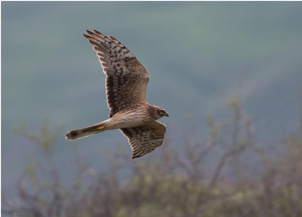
Stäpphök hona Besh barmag 2016

Här såg man ett gott sträck av ängshökar, stäpphökar och örnar men också många stora flockar av svartvingad vadarsvala.