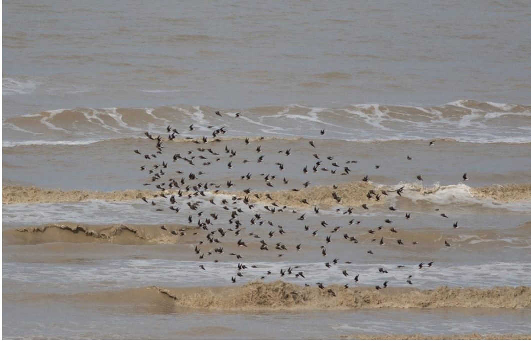
Flock av svartvingad vadarsvala Besh barmag 2016, foto Andreas Sandberg

Ett annat stop på resan var uppe i bergen. Där gjorde dom ett besök i en bergsby som heter Xinaliq. Avsikten var att hitta bl.a. kaukasisk orre, kaukasisk snöhöna och bergrödstjärt. Inkvarteringen var ganska spartansk. Huset hade centralvärme. I golvet fanns springor och under golvet hölls boskapen som på så sätt fick bidra till uppvärmningen. Ekologiskt -enda nackdelen var den fräna doften.