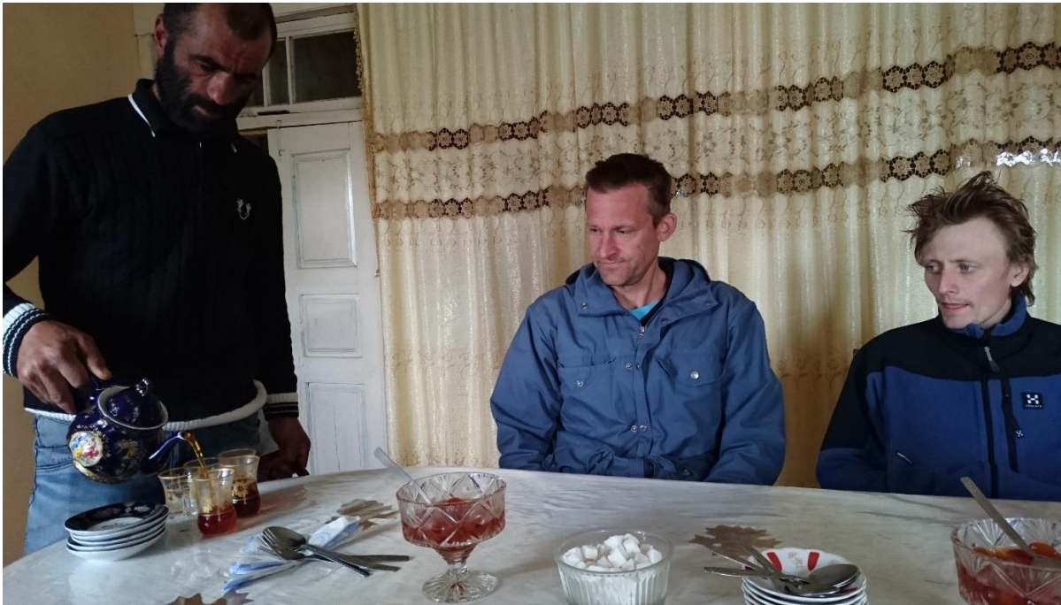
Inkvarteringen i Xinaliq