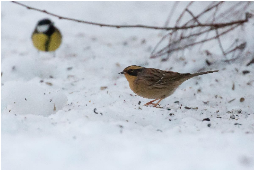
Sibirisk järnsparv Lindesberg 2016-12-18