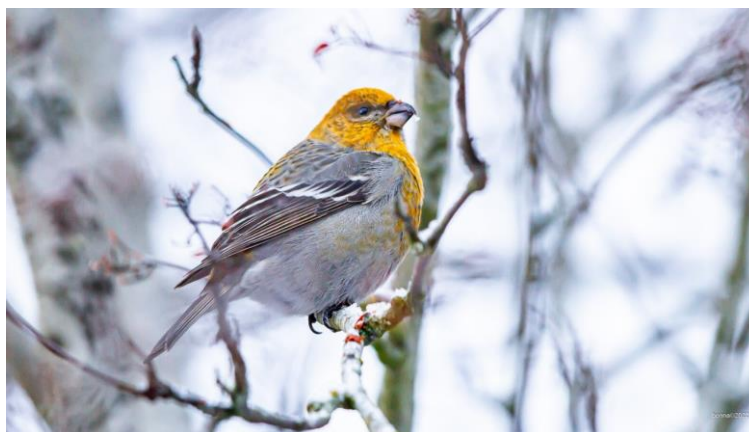
Tallbit vid Frövi 5 januari 2022

Lag 5 Mona Wallin, Ulla Wallin, Sven-Olof Eriksson