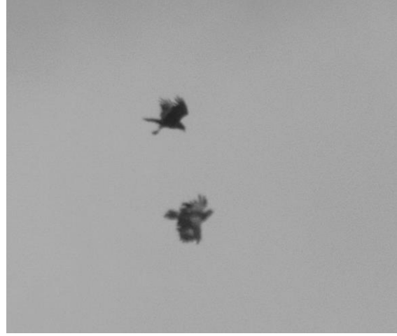
Mindre skrikörn med brun kärrhök