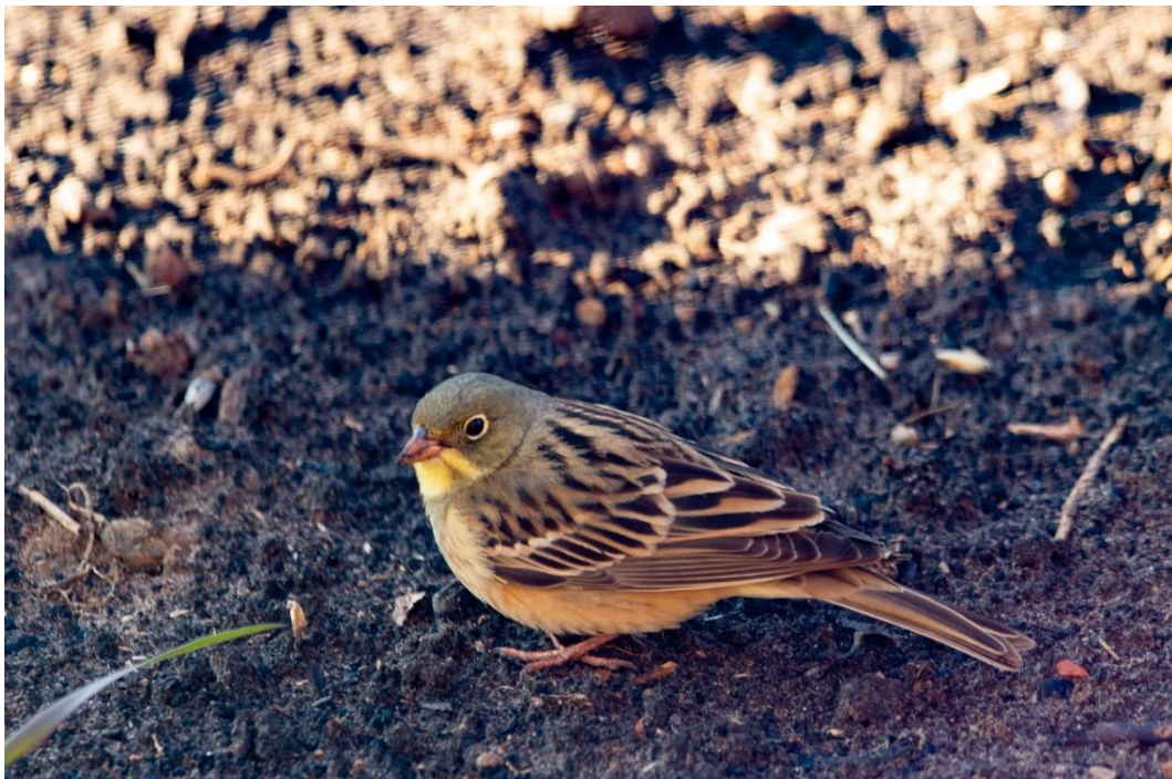
Ortolansparv Laggars 3 maj 2023