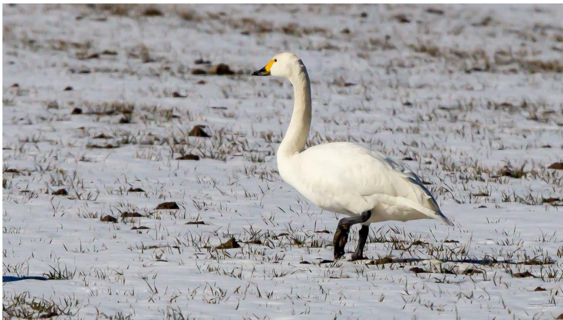
Mindre sångsvan på Sällingegårderna 2 april 2023