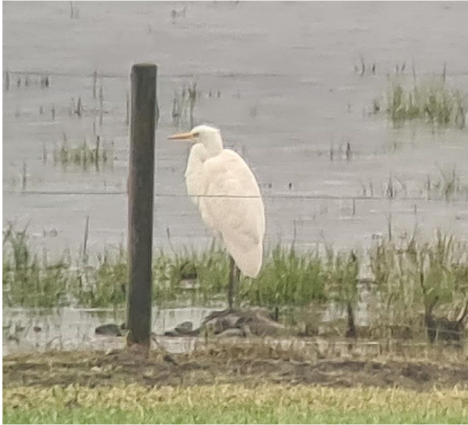
Ägretthäger 23 april 2023 vid Sörbysjön