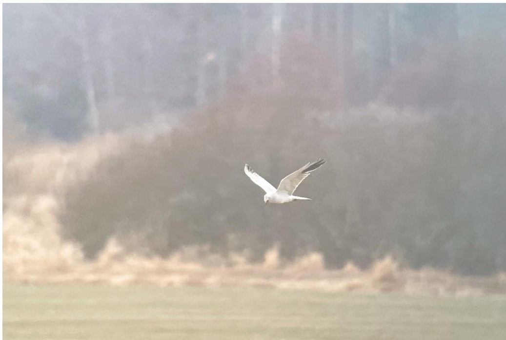
Stäpphök Västvalla 14 april 2023, foto Johan Wretenberg